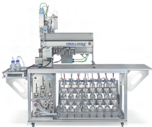
SPE automat Freestyle XANA

SPE automat Freestyle XANA určený nejen pro přípravu vzorků při stanovení PFAS ve vodách, který minimalizuje kontaminaci vzorku během procesu přípravy, nabízí německý výrobce LCTech. Výrobce rozšířil modulární platformu Freestyle o autosampler pro 24 kusů jednolitrových lahví a o možnost zpracování až 10 L vzorku. Třípozicové uspořádání SPE automatu a možnost současné aplikace různých procesních kroků na různé kolony v jedné chvíli významně urychluje přípravu vzorků a zvyšuje výkon přístroje.